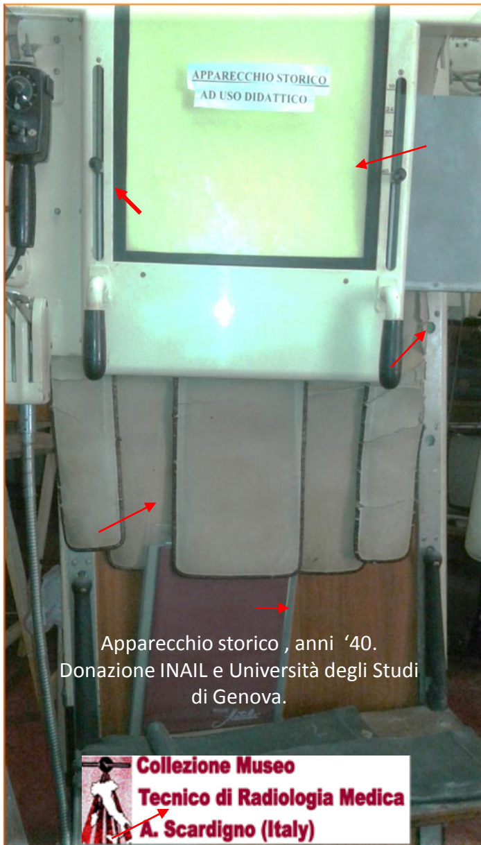
Apparecchio storico , anni '40. Donazione INAIL e Università degli Studi di Genova.