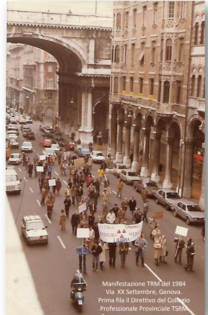
Manifestazione TRM del 1984 Via XX Settembre, Genova. Prima fila il Direttivo del Collegio Professionale Provinciale TSRM

Possiamo ricordare tuttavia certamente i primi Presidenti della Federazione Nazionale TSRM (FNCPTSRM) e il primo dei Fondatori dell'ANTIR che riconosciamo, e ricordiamo, attraverso i segni della loro attività tecnica-professionale e politica sociale pubblicata nel testo " Normativa e storia illustrata tecnico-sanitaria di radiologia medica " e custoditi nella "Collezione-Museo TRM privato, Genova.